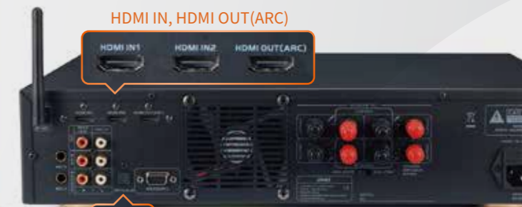
HDMI IN, HDMI OUT(ARC)