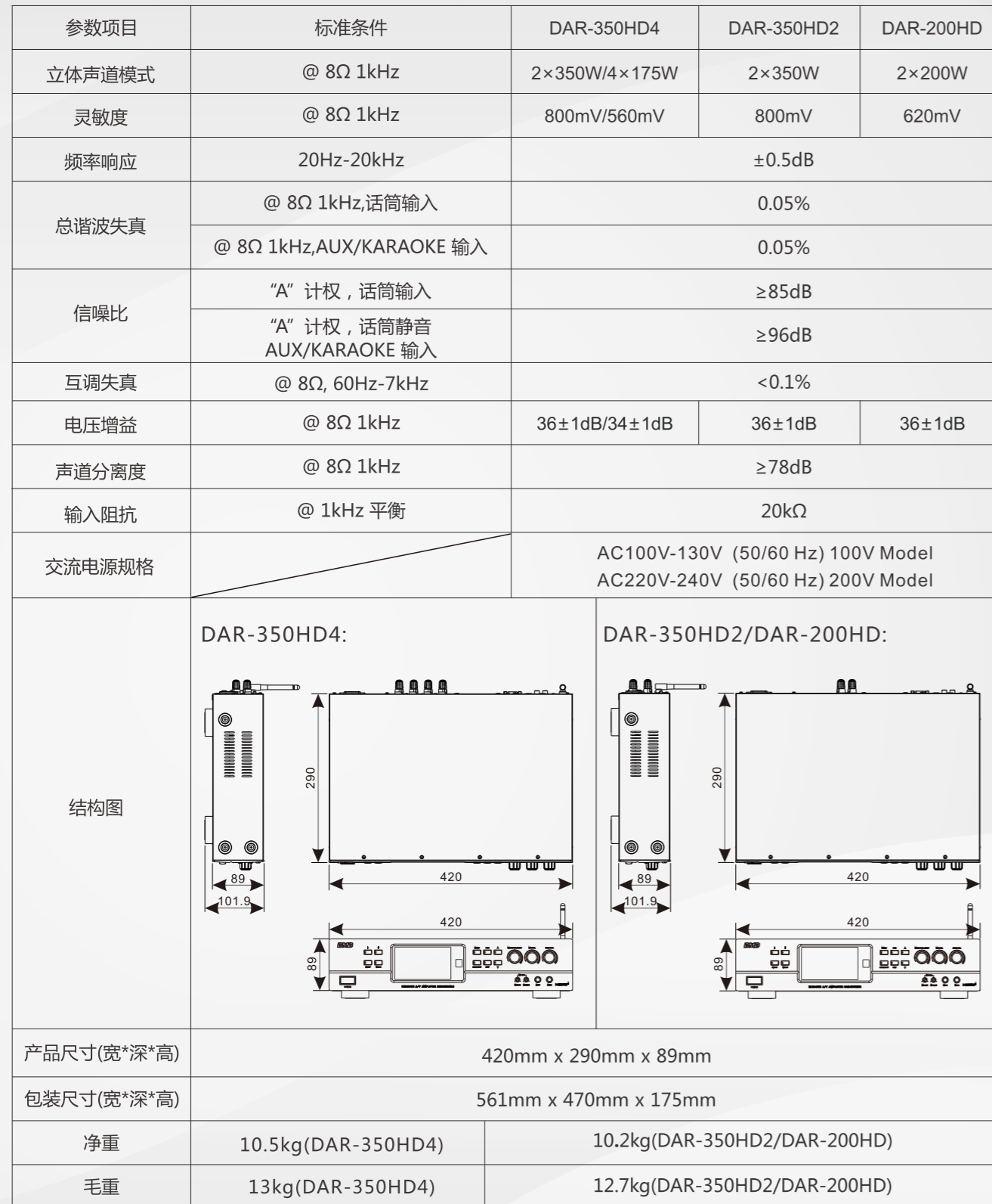
卡拉OK功率放大器参数表